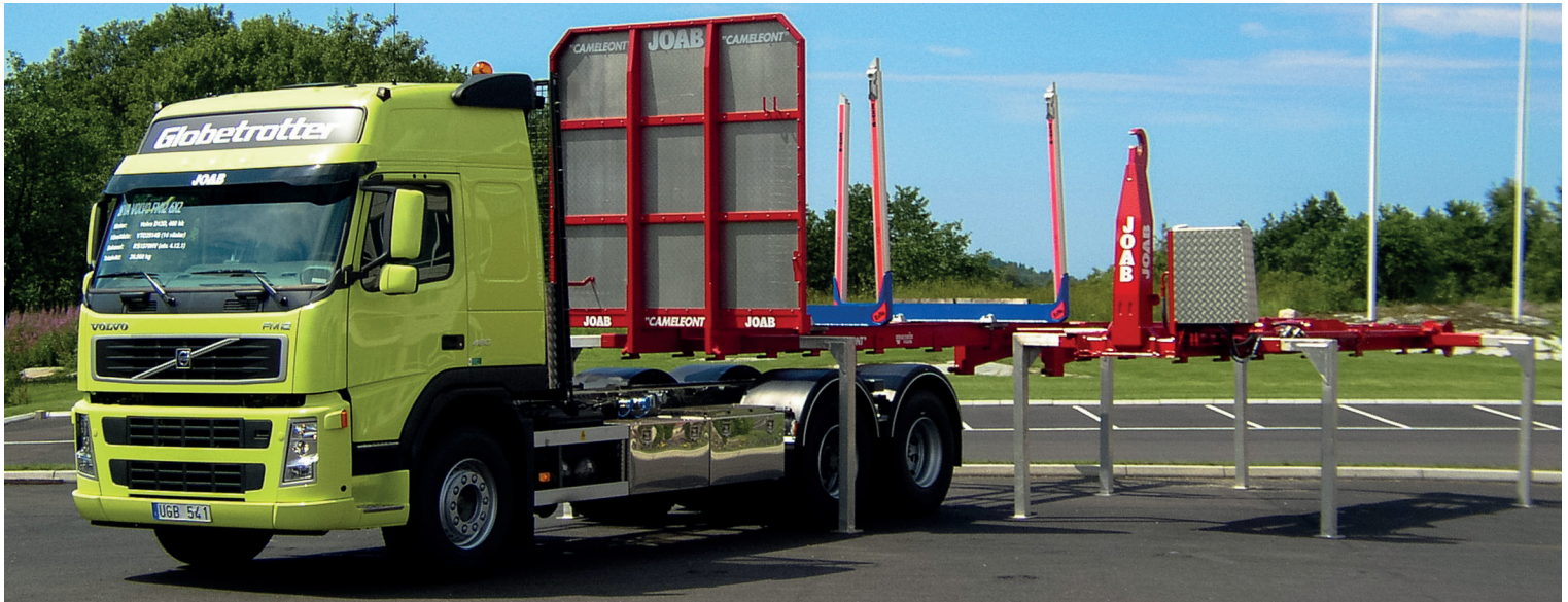
Cameleont - JOABs skiftessystem.