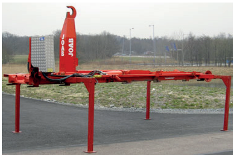
Cameleont - lastväxlare.