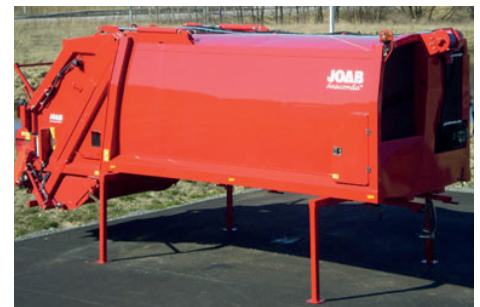
Cameleont - sopbilsaggregat.

JOAB Försäljnings AB Östergärde Industriväg 50 417 29 Göteborg, Sweden Tel: +46 (0)31 705 06 00 info@joab.se