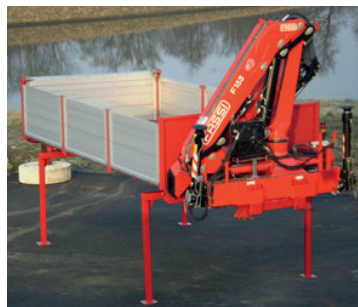
Cameleont - kran.