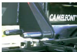
Twindubbsinfästning för kranflak