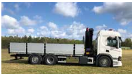
Standardiserad design och specifikation för att motsvara kunders behov och utmaningar.

För att användarna ska kunna utföra arbetet så säkert som möjligt har fastflaken designats med goda lastsurrningsmöjligheter med cirka 120 noga utvalda lastsäkringspunkter i standardutförande och är därmed anpassade för att täcka Europannormen EN 12640.