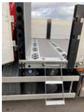
Inbyggd stege, kan fås både på höger och vänster sida.