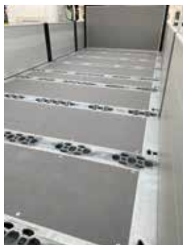
Flaket är utrustad med hål för godsstöttor fördelat över hela flakytan.