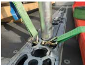
JOABs surrningsssystem uppfyller Europannormen EN 12640.