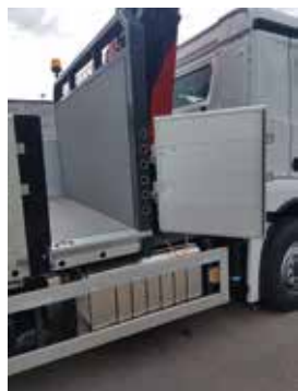
Flakdörr underlättar arbete med flaket.